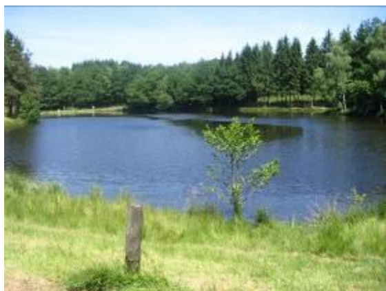
Etang du Masvaudier